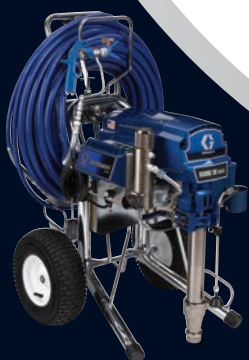
MARK VII™ MAX PLATINUM