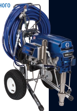
MARK X™ MAX PLATINUM

Установка, укомплектованная системой ProConnect™ (быстрая замена насоса), QuikReel™, регулятором давления E-control и системой очистки FastFlush, образует наиболее компактную систему безвоздушного распыления, используемую для нанесения краски и шпаклевки. Помимо этого, длина шланга была увеличена на 15 метров (теперь она составляет 30 метров), также была увеличена длина гибкого шланга-поводка и добавлено откидывающееся назад основание, облегчающее замену бака с краской. MARK MAX Platinum; Эталон качества для электрических безвоздушных распылителей.