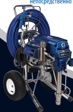
MARK V™ MAX PLATINUM